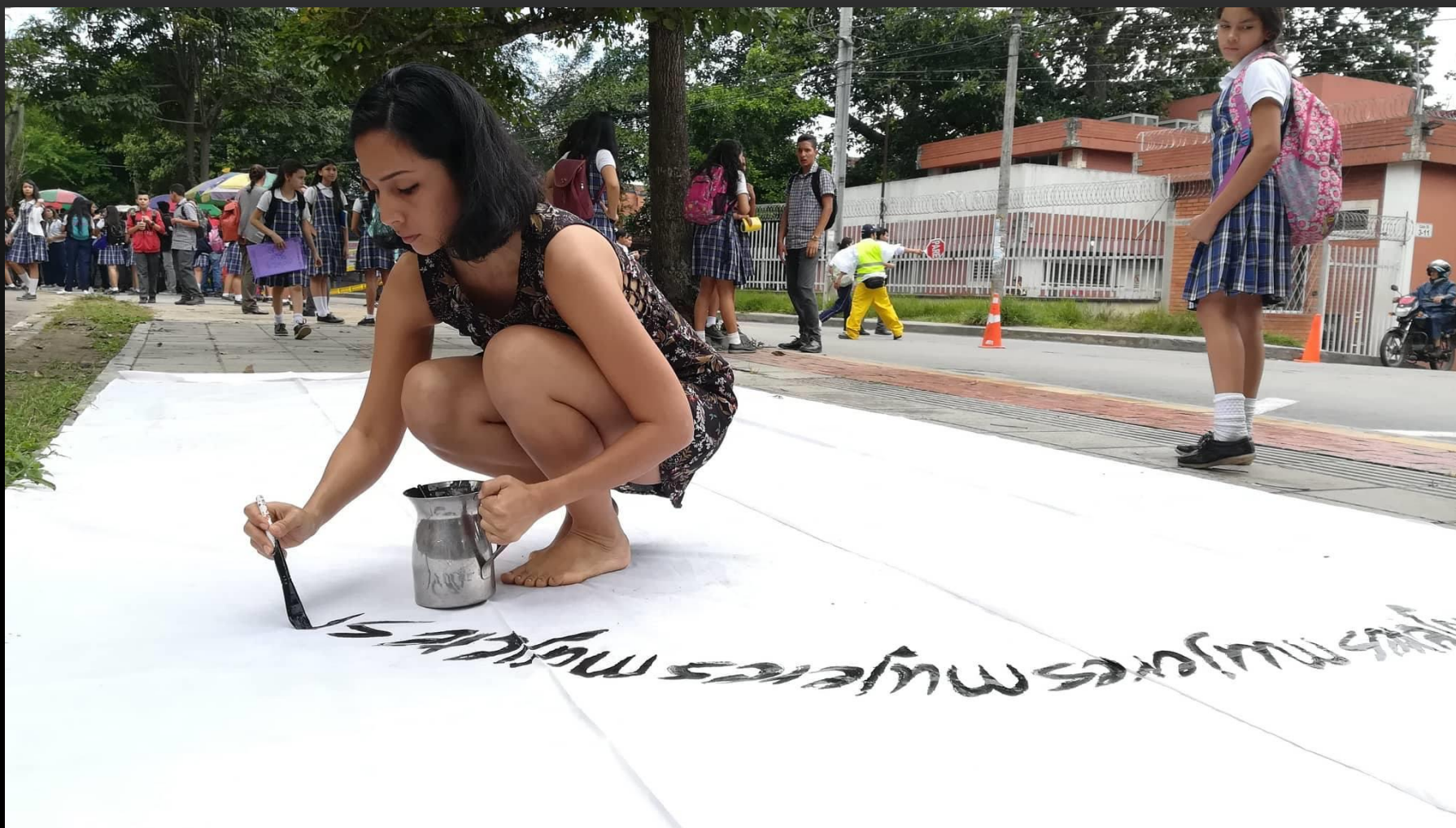
Presentado en mayo del 2018 en el, FESTIVAL INTERNACIONAL DE PERFORMANCE ACCIONES AL MARGEN 6, Bucaramanga.